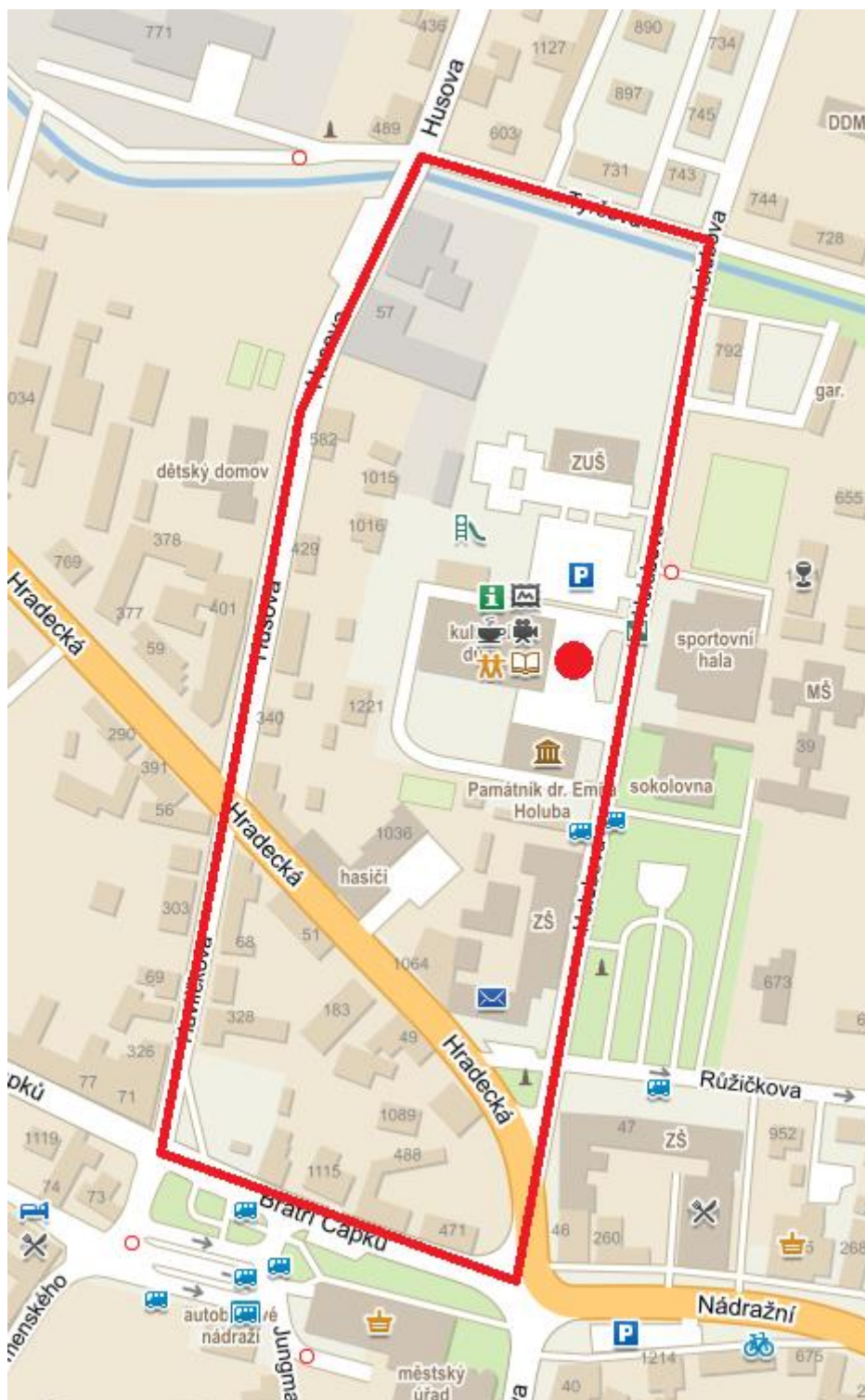
Příloha č. 1