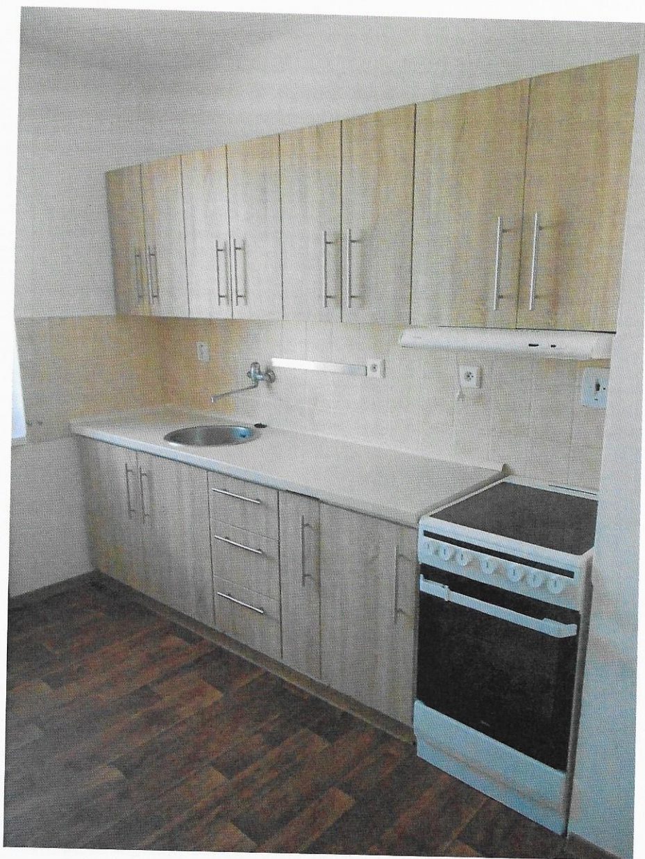
Příloha č. 2: foto bytu č. 7 v domě č.p. 1103 na Mušce, Holice